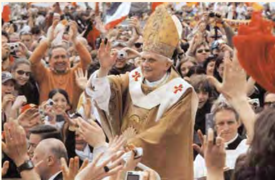
A sinistra: Benedetto XVI, con la Mitria e il Pallio ricevuti il giorno della Sua "incoronazione", tra la folla, durante la sua prima visita in Germania.