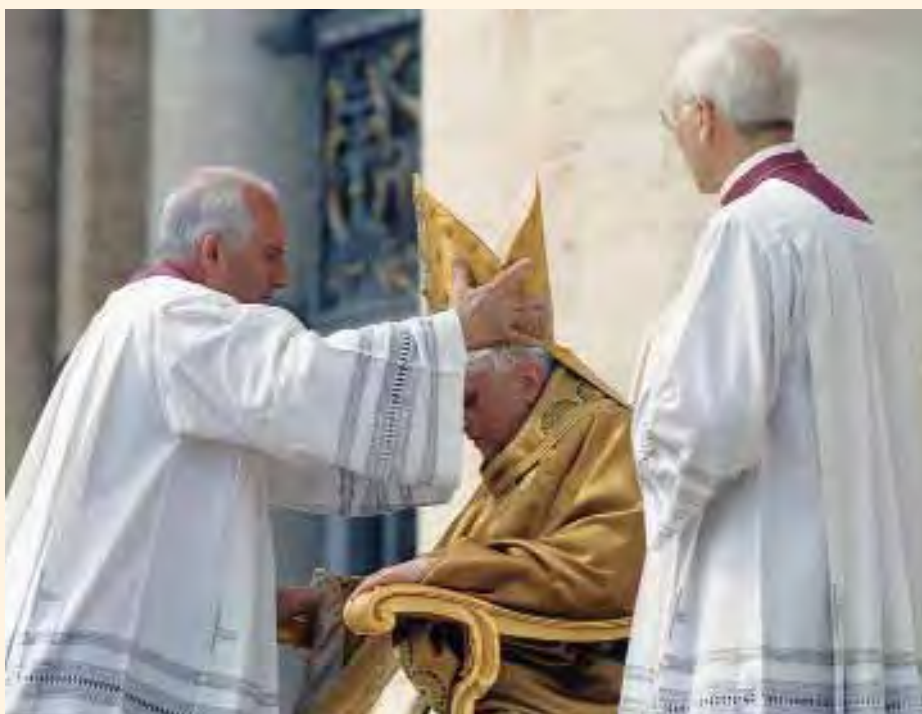
24 aprile 2005. Benedetto XVI riceve la Mitria, il giorno della Sua "Incoronazione".