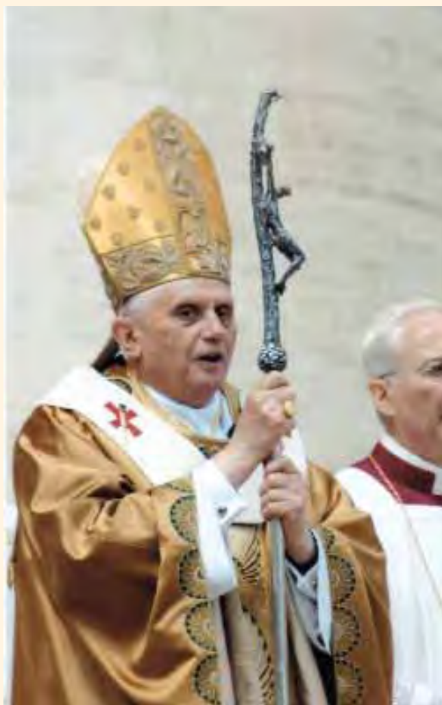
Sopra: 24 aprile 2005. Benedetto XVI dopo aver ricevuto la Mitria, il Pallio e il Pastorale, il giorno della Sua "Incoronazione".