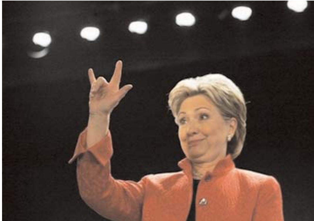
À partir d'en haut, en sens horaire: l'ex président américain Bill Clinton , sa femme Secrétaire d'État, Hillary Clinton , l'ex président américain George Bush avec sa femme, George Bush avec sa fille, l'ex vice président Dick Cheney , George Bush .