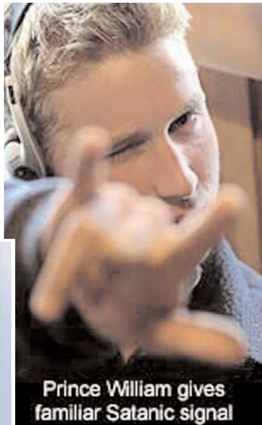
Prince William gives familiar Satanic signal