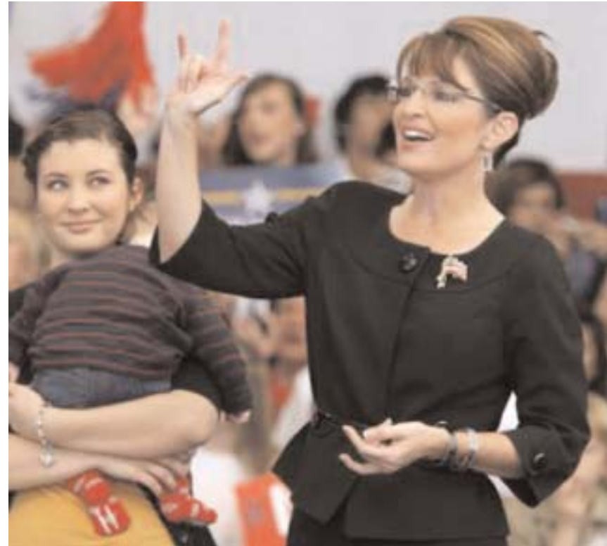
À partir d'en haut en sens horaire: Le président français Sarkozy, le gouverneur de l'Alaska Sarah Palin, le prince William, le président américain Barak Obama, l'ex vice président Dan Quayle.