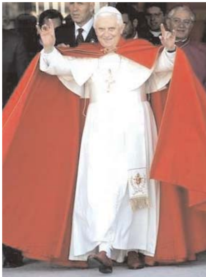
Benoît XVI, dans une photographie du 23 Février 2009.

Sur cette photo, Benoît XVI , les deux bras levés, montre les mains dans une position étrange. Les petits doigts et les index levés, les deux doigts du milieu pliés vers la paume et les pouces détachés de la paume de la main.