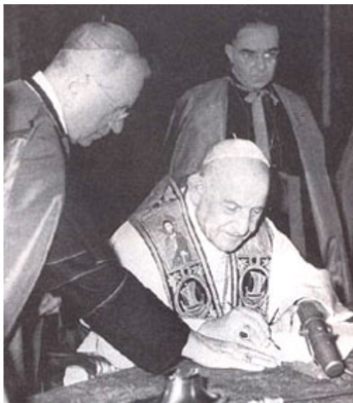
Jean XXIII signant son encyclique,

I l est facile d'édifier à partir d'une vue abstraite de la nature humaine une doctrine morale et un programme politique où le respect des droits de l'homme et des peuples développe sereinement ses exigences, où le sentiment du devoir impose en contrepartie à chacun de prendre sa part de l'effort commun en vue de tous. On en arrive alors, pour peu qu'on oublie les conditions concrètes et les lois qui régissent nos communautés, qu'on néglige le péché originel et la malice des hommes, à esquisser le tableau d'une communauté mondiale libre, égale et fraternelle, où chaque homme et chaque peuple reçoivent tout autant qu'ils peuvent naturellement désirer, où les nations sont indépendantes et les religions, cultures et idéologies s'accordent et « convergent », où il n'y a plus de peuples dominateurs et de peuples dominés, où enfin les hommes de bonne volonté désirant dans leur cœur profond la paix et l'harmonie, ayant fait litière des malentendus ancestraux et